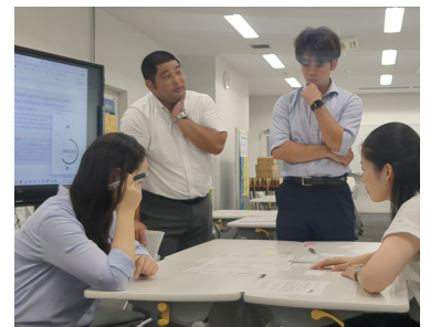
SHIBAURA探究プログラム設計のために教員たちも日々探究しています